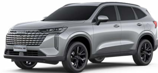
Ayers Grey (Metallic)