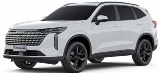
Moonlight White (Metallic)

Wählen Sie den Haval H6, der perfekt zu Ihnen passt. Dafür stehen Ihnen eine Palette eleganter Karosseriefarben sowie zwei Ausstattungsvarianten – Premium und Luxury – zur Verfügung.