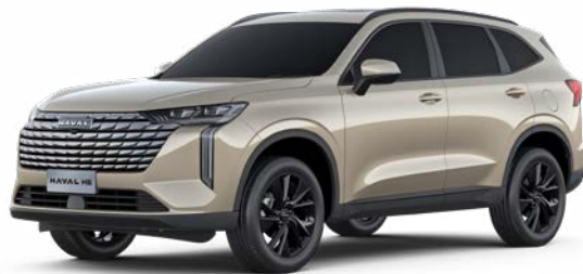
Noble Gold (Metallic)