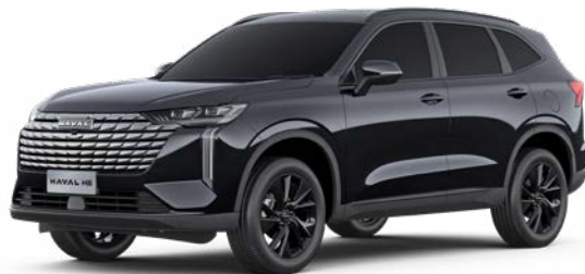
Starry Black (Metallic)